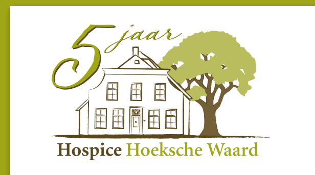
^ Het lustrum logo van de hospice

De studenten willen alle Hoeksche Waarders die hen geholpen hebben door het geven van hun tijd en medewerking bij het invullen van de vragenlijsten bedanken. Ze waren zelfs een beetje verbaasd door zoveel medewerking: "Heel anders dan in de stad, daar lopen mensen snel door als je ze wat wilt vragen. Hier zijn mensen veel toegankelijker. Ze nemen even de tijd. En zeker als we vertelden dat het over de hospice ging, dan wilden mensen graag meewerken. Soms werden we zelfs binnen gevraagd! Vaak kwamen hele gesprekken op gang". Voor de jonge studenten een bijzondere ervaring.