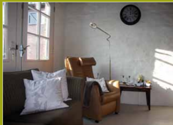
^ Het interieur in het Koetshuys